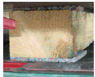
Holzbalken mit RHM